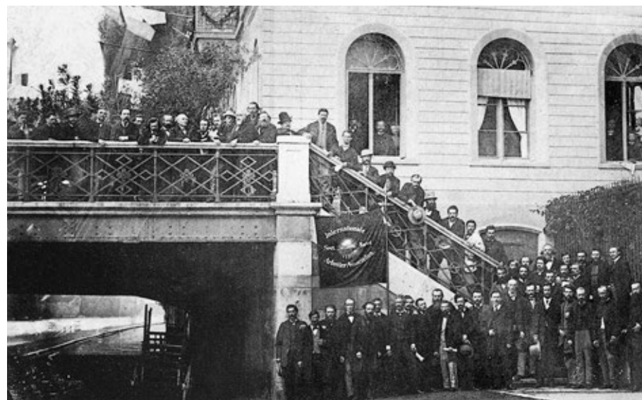
Gruppenbild des Kongresses der Ersten Internationalen 1869 in Basel

Bald darauf suchte Hess Anschluss an die 1864 in London gegründete Internationale Arbeiterassoziation (IAA/Erste Internationale), in deren Präsidium Marx saß. In der Folgezeit schrieb er auch für Organe, die der IAA nahestanden, lobte den gerade erschienenen ersten Band des »Kapitals« und trug sich mit dem Plan einer Übersetzung ins Französische. Dabei motivierte ihn vor allem der Gedanke, durch seine Kritik des Geldwesens