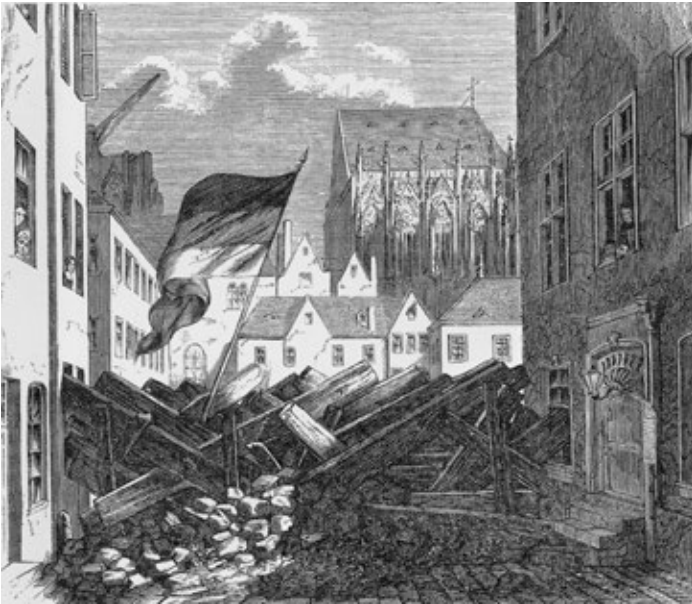
Revolution und Barrikaden 1848 auch in Köln

Militär. Auch in Köln eskalierte die Lage, hier schienen die Bedingungen für eine Revolution nach französischem Vorbild besonders günstig: Die 1840er-Jahre hindurch waren die unteren Schichten noch mehr verarmt. Missernten, Überschwemmungen und 1847/48 eine schwere Spekulationskrise im Baubereich hatten die Situation weiter verschärft. Zudem existierten eine klassenübergreifende antipreußische Grundhaltung sowie etablierte oppositionelle und sogar kommunistische Strukturen vor Ort.