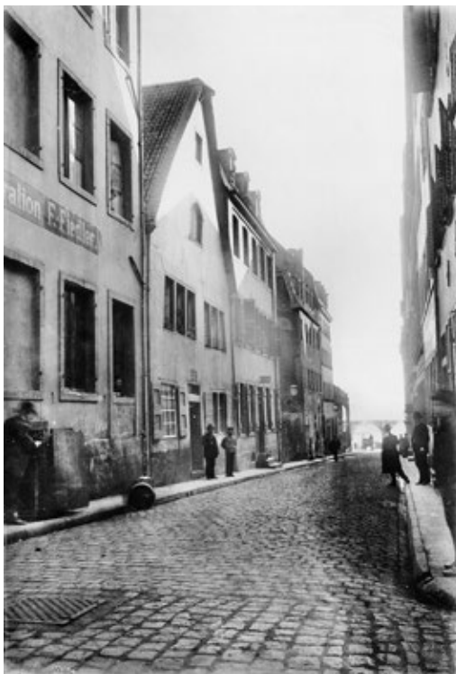
Die Bonner Tempelstraße, ehemals Juden-gasse, 1897